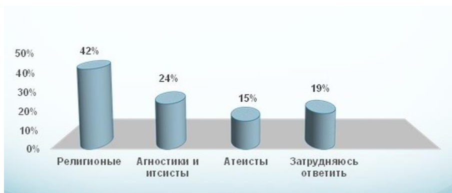
Рисунок 2. Религиозная ситуация в подростковой среде на примере московских школ (2018 г.)

Согласно результатам исследования, проведенного в 2018 году, 42 % от общего числа опрошенных столичных школьников (1563 обучающихся 5–9 классов московских школ) считали себя религиозными людьми (четыре года назад таких взглядов придерживалось 36 % подростков). Агностиков и итсисов среди современных респондентов оказалось 24 % (этот показатель четырехлетней давности мало изменился, в 2014 году он составлял 22 % опрошенных), атеистов – 15 % (против 18 % четырьмя годами ранее) и 19 % опрошенных затруднилось с ответом в 2018 году, тогда как в 2014 году таковых респондентов было 24 %.