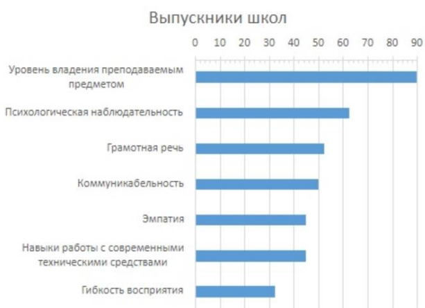
Рисунок 5. Наиболее важные качества учителя по мнению опрошенной группы «Выпускники школы»

Во всех опрошенных группах среди качеств учителя лидером по важности является уровень владения преподаваемым предметом , что говорит о высокой осознанности всех участников образовательного процесса: все – от школьников до выпускников – понимают, что в первую очередь школьное обучение служит получению знаний и получать их эффективно можно лишь в случае, если учитель разбирается в своем предмете и умеет раскрыть его для других.