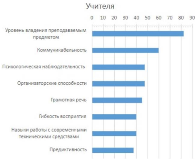
Рисунок 1. Наиболее важные качества учителя по мнению опрошенной группы «Учителя»