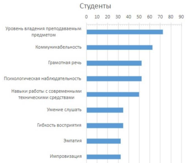
Рисунок 3. Наиболее важные качества учителя по мнению опрошенной группы «Студенты»