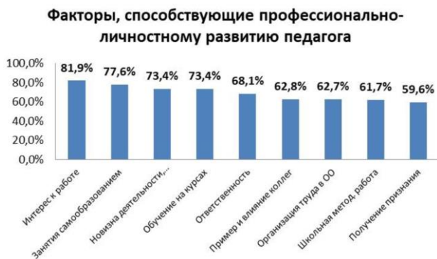
Рисунок 1. Степень выраженности факторов, способствующих профессионально-личностному развитию педагогов Ленинградской области

Согласно полученных данным (см. рисунок 1), среди факторов, способствующих профессионально-личностному развитию, представляется возможным выделить те, которые оказывают определяющее позитивное влияние на данный процесс: интерес к работе (81,9 %), занятие самообразованием (77,4 %), новизна предполагаемой деятельности (73,4 %), обучение на курсах (73,4 %). Вместе с тем педагоги в меньшей степени стремятся к получению признания (59,6 %). Таким образом, подтверждается актуальность более широкого использования стратегий и принципов неформального и информального образования при организации сетевого образовательного процесса.