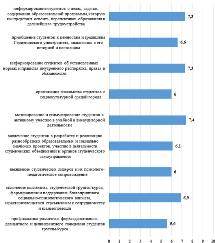
Рисунок 2. Самооценка деятельности кураторов по направлению «Содействие адаптации студентов в образовательной среде вуза» (в средних баллах, максимальное значение – 10 баллов)

По направлению «Содействие повышению качества и эффективности процессов обучения и воспитания студентов» актив-