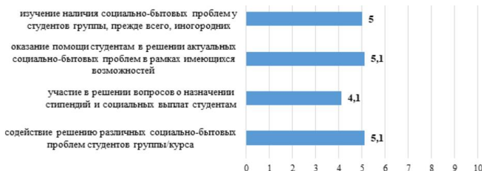
Рисунок 5. Самооценка деятельности кураторов по направлению «Содействие решению социально-бытовых проблем студентов» (в средних баллах, максимальное значение – 10 баллов)

Кураторы нуждаются в создании эффективных административных механизмов в области социального-бытового обеспечения студентов.