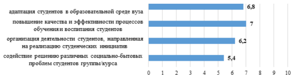
Рисунок 1. Самооценка кураторами степени активности по основным направлениям кураторской деятельности (в средних баллах, максимальное значение – 10 баллов)

Исследование самооценки активности по указанным в Регламенте направлениям кураторской деятельности (рисунок 1) показало, что кураторы прежде всего уделяют внимание повышению качества и эффективности процессов обучения и воспитания студентов, адаптации студентов в образовательной среде университета. Кураторы менее активны в организации деятельности студентов по реализации студенческих инициатив и содействии решению социально-бытовых проблем.