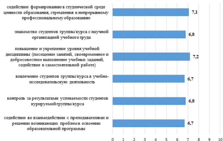
Рисунок 3. Самооценка деятельности кураторов по направлению «Содействие повышению качества и эффективности процессов обучения и воспитания студентов» (в средних баллах, максимальное значение – 10 баллов)

ность кураторов достаточно высока, результаты по составляющим этой деятельности близки друг к другу (рисунок 3).