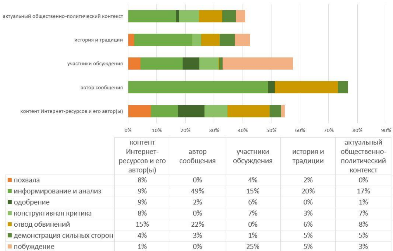
Рисунок 1. Частота конструктивного выражения интенций по отношению к основным референциальным объектам

На рисунке 1 представлены частоты конструктивного выражения интенций пользователей по отношению к референциальным объектам. Наиболее часто пользователи выражают интенции позитивно-оценочного и нейтрального характера по отношению к самим себе и другим участникам дискуссии. Подобные интенции также обращены к контенту Интернет-ресурсов и их авторам. При этом других участников дискуссий пользователи чаще всего побуждают к продолжению обсуждения или совершению каких-либо действий, тогда как в отношении самих себя склонны информировать о своих состояниях, фактах биографии, пережитом опыте. Информирование и анализ также является наиболее выраженной конструк-