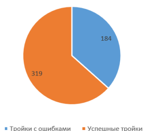
Рисунок 1. Общее количество троек

За последний год было проведено 503 учебных троек, из которых 319 были успешными, а 184 – с ошибками, что составляет 63% и 37% соответственно. Исходя из предоставленной статистики, учебные супервизии научили участников находить свои «слабые зоны» и прорабатывать их, развивать свои профессиональные качества, как, например, в случае навыка формулирования вопросов и проведения конструктивного опроса «клиентов» (рисунок 1).